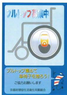
プルトップ募集のポスター

コロナ禍以前は施設でのボランティア活動や公園の清掃活動等も行っていましたが、高齢だったり、遠方で参加が難しい組合員もいます。負担なく続けられるプルトップの回収は継続して参加しやすい社会貢献だと好評です。