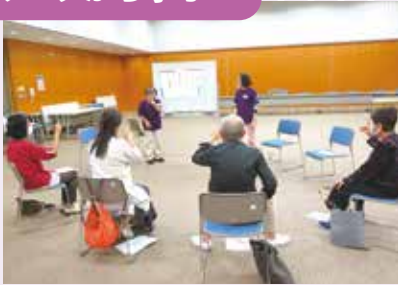
右京区／やさしい手話入門講座