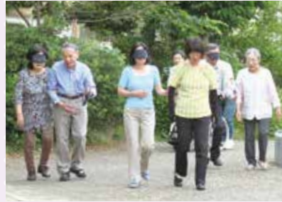
東山区／視覚障がい手引体験講座