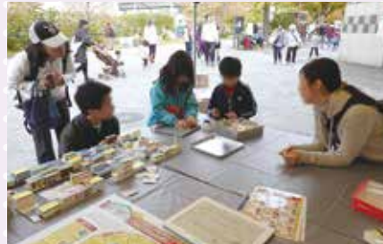
地域のイベントの中で 下京区／やさしいまちづくり会議

各区でボランティア活動に関する講座を開催しています。詳細は各区ボランティアセンターにお問い合わせください。