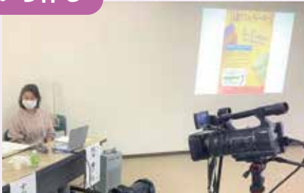
オンラインで 南区／ボランティア入門講座

コロナ禍でオンラインでの講座も増えたよね。イベントでは、さまざまな世代の人が興味を持って集まってくれるよ。