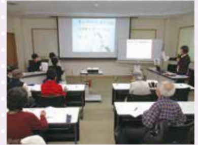
東山区／要約筆記体験講座