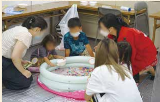
夏まつりを開催して、子どもたちの思い出づくりをサポート。