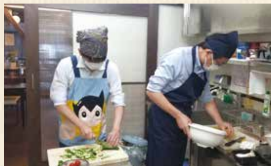
子ども食堂の食事準備ボランティアに参加しました！