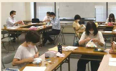
社員でタオル帽子を作成して、がん患者を支援する団体に寄贈しました。

ボランティア活動に参加したい人、物品提供で協力したい人など自分で考えてやりたいことに取り組むことって大事だよ。