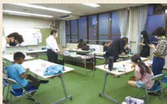
中京いきいき市民活動センターで子どもたちといっしょにマスクケースを作りました。