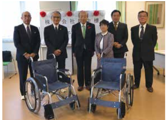
寄贈も出会いの場 株式会社紅中さんと西京区の地域団体が 車いすの寄贈を通じてつながる