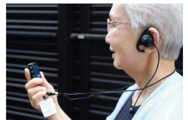
イヤホン・マイク

助成金の申請にあたっては「コミュニケーションの場を作る」「おしゃべりを楽しむ」という、つるかめ笑顔クラブが大事にしてきたことを、具体的に記載することを意識して申請書類を作成しました。