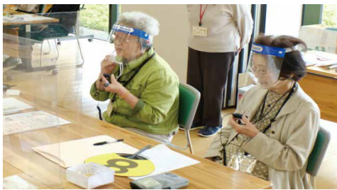
イヤホン・マイクを使った思い出語りの会

一人暮らしや身近に友だちがいなくて、誰かとおしゃべりする機会がほとんどない高齢者も少なくありません。「共通の話題で盛り上げられることがうれしい」「もっと回数を増やしてほ