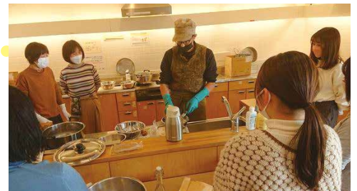
ボランティア研修