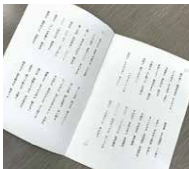
「こうゆう句」をまとめた冊子

この活動を必要としている当事者とのつながりが少しでも増えるよう、今後も取り組んでいきます。