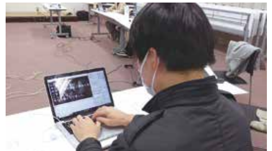
パソコンを用いた要約筆記

文字で伝えるという自分にできることで中途失聴・難聴の人の助けになり、喜びや笑顔につながることはとても嬉しいです。これからも、中途失聴・難聴の人の声を聴き、それに応えていきたいです。